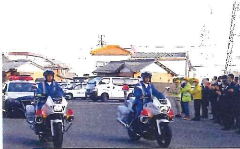
12月・年末特別警戒出発式。一日警察署長と人波作戦