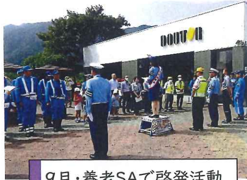
9月・養老SAで啓発活動