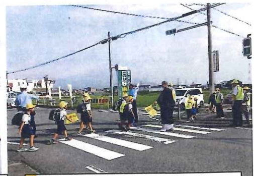
7月・下笠野崎交差点、 登校児童の見守り活動