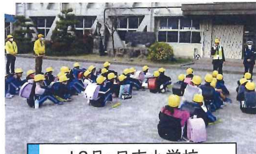
12月・日吉小学校 下校時交通安全指導