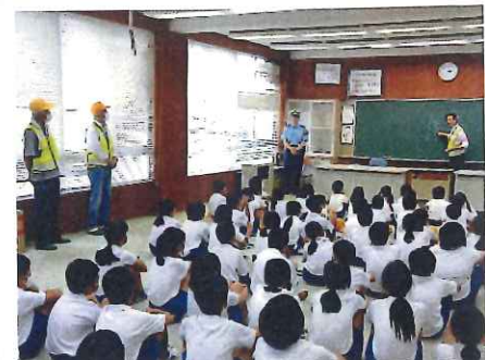
7月・広幡小学校 下校時交通安全指導