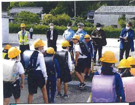
5月・時小学校 下校時交通安全指導