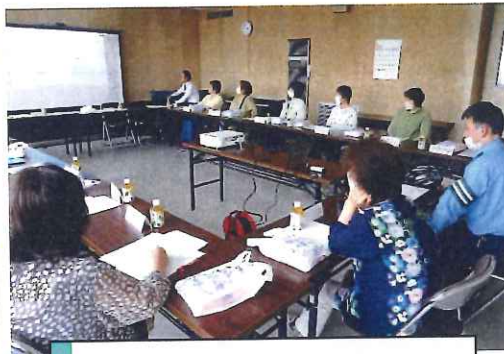
5月・各地区女性部長会議