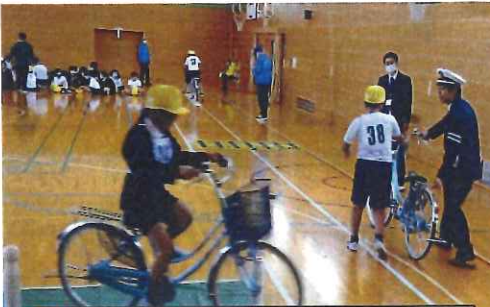
11月・笠郷小学校5年 自転車講習会