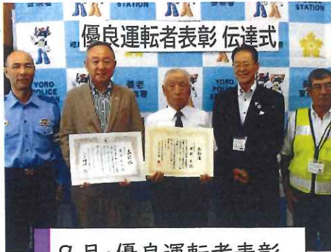
9月・優良運転者表彰