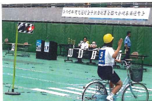
7月・池辺小6年、自転車大会出場 OKBアリーナにて