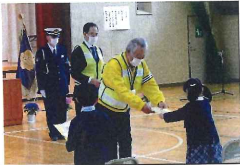
4月・新入学児童全員に 反射材付きランドセルカバー贈呈 牧田小学校にて