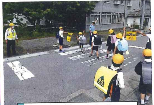
5月・牧田小学校 下校時交通安全指導