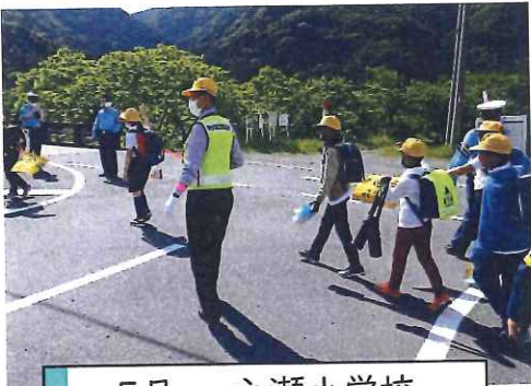
5月・一之瀬小学校 下校時交通安全指導