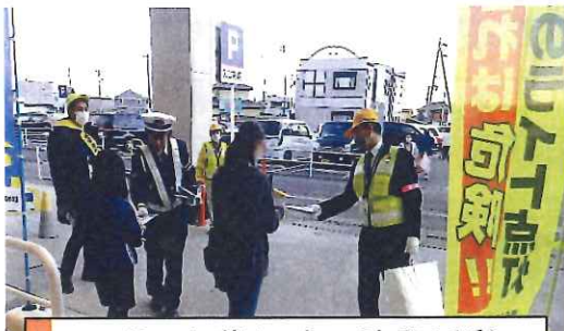
11月・夕暮れ時の啓発活動 カネスエ養老店にて