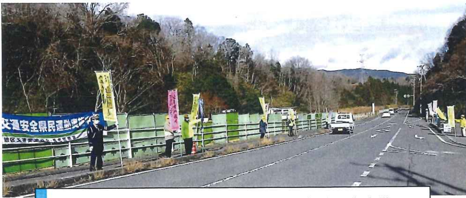
12月・緑の村公園前、国道365号線で人波作戦