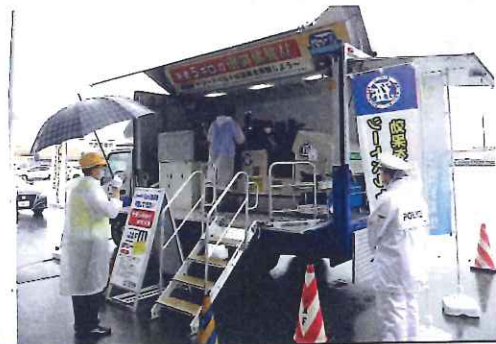
6月・シートベルト着用体験、 ホームセンターバロー養老店にて