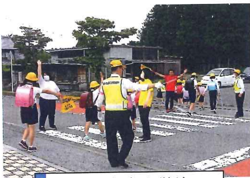
6月・多良小学校 下校時交通安全指導