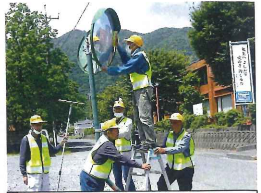
カーブミラー清掃・点検(各分会)