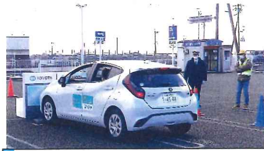
12月・ホームプラザナフコでサポートカー体験会、店頭では啓発活動