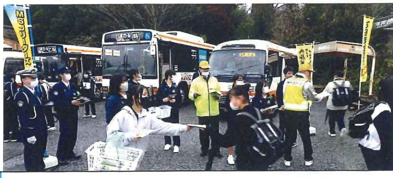
12月・上石津中学MSJリーダーズとの下校時啓発活動