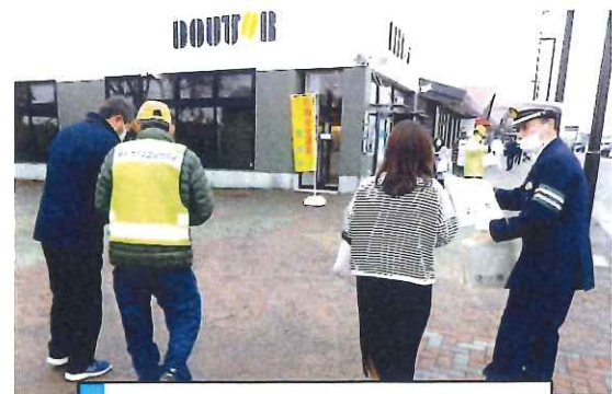
12月・養老SAで啓発活動