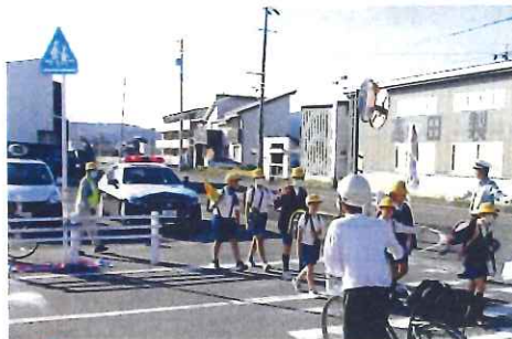
10月・養北小学校 下校時交通安全指導