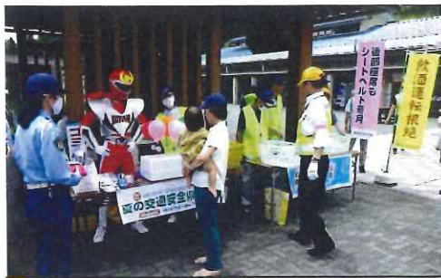
7月・月見の里南濃で啓発活動 (海津署と合同)