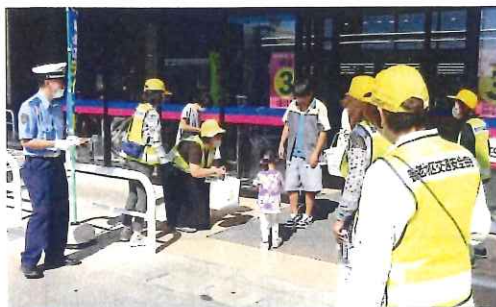
9月・女性部による啓発活動 (手作りマスコットを配布)