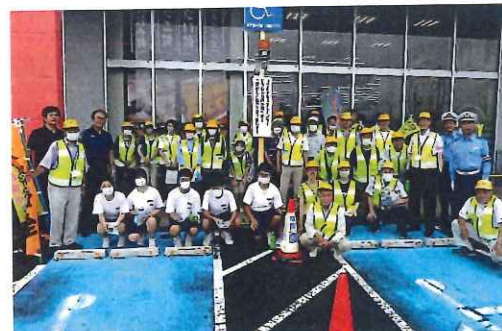
7月・池辺分会、人波作戦と店頭で 啓発活動、オークワ養老店にて