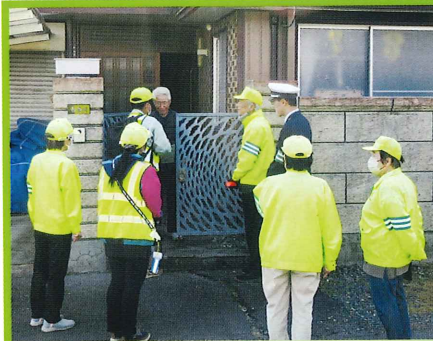
高齢者宅交通安全啓発めなかな訪問