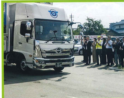
デザイントラック・秋の全国交通安全運動出発式