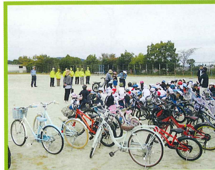
多治見市立脇之島小学校自転車教室