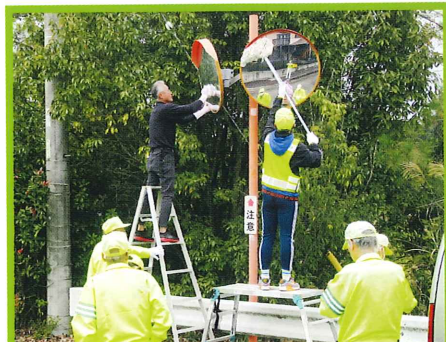
多治見支部北栄分会カーブミラー清掃