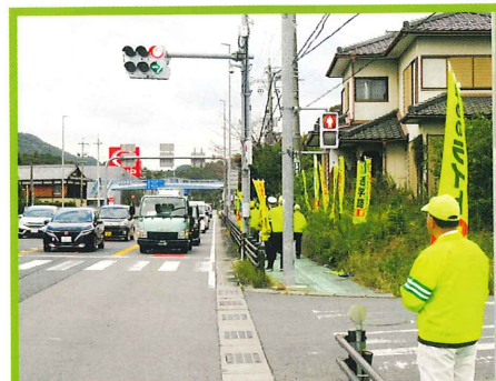
4時だよ! 全員点灯! 人波作戦