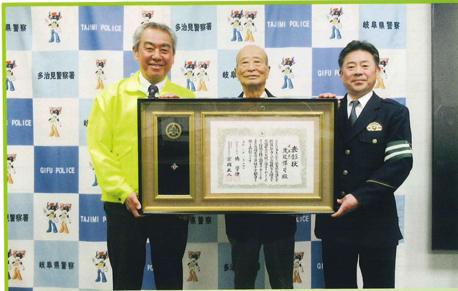
交通安全功労者 交通栄誉章 「緑十字銀章」受章報告

交通安全の輪を広げるために 交通安全協力金のご協力 ありがとうございます 現在、運転免許を保有している皆さんには、 免許更新の際に協力金のご協力をいただいで おります。このお金は、交通安全活動に使わ せていただいています。 今後も皆さんのご協力を お願いいたします